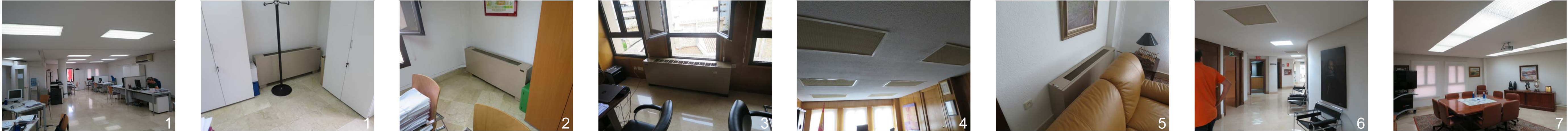
REPORTAJE FOTOGRÁFICO OBRAS A REALIZAR