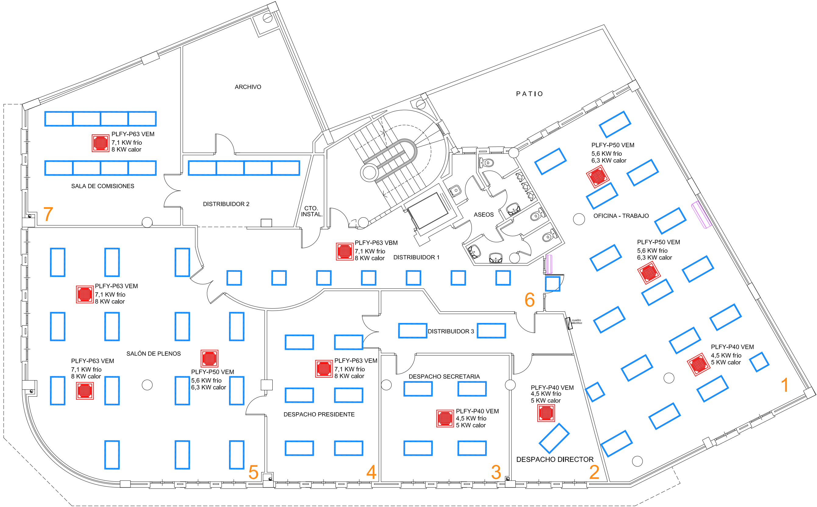
PLANTA TERCERA ESCALA 1:100