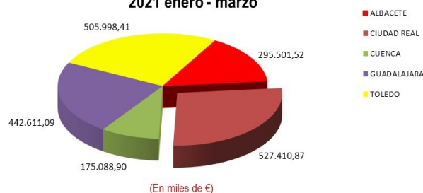
Exportaciones de Castilla-La Mancha 2021 enero - marzo

Ciudad Real sigue en el 1er puesto entre las provincias exportadoras de CLM, seguida de Toledo.